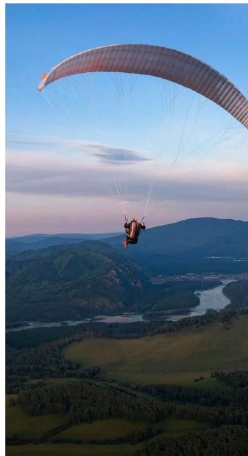
Полет на паратране