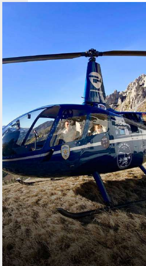
Прогулки на вертолете